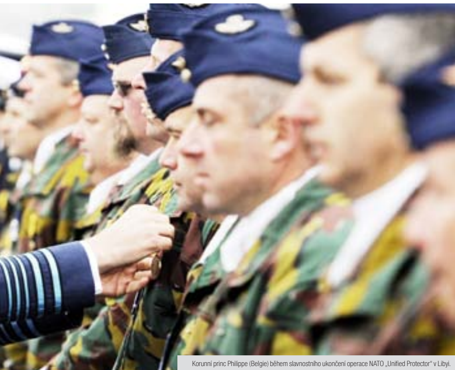
Korunní princ Philippe (Belgie) během slavnostního ukončení operace NATO „Unified Protector“ v Libyi.

li libyjskou operaci prezentovat jako úspěšný začátek nové éry dělby práce, v rámci které Evropa přebírá větší díl zodpovědnosti za bezpečnost na své periferii, je to, že se jí aktivně zúčastnilo pouhých 6 z 26 evropských členských států. To je méně než čtvrtina. Dlouhodobé americké výčitky, že evropští spojenci nedělají dost, jsou proto stále platné. Naprostá většina evropských spojenců skutečně stále dost nedě-